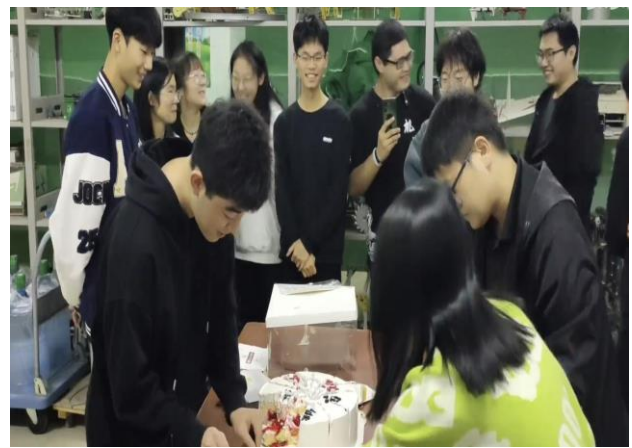
图 3-10、图 3-11 团建聚餐