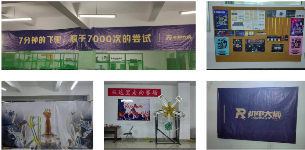
图 3-15 文化墙