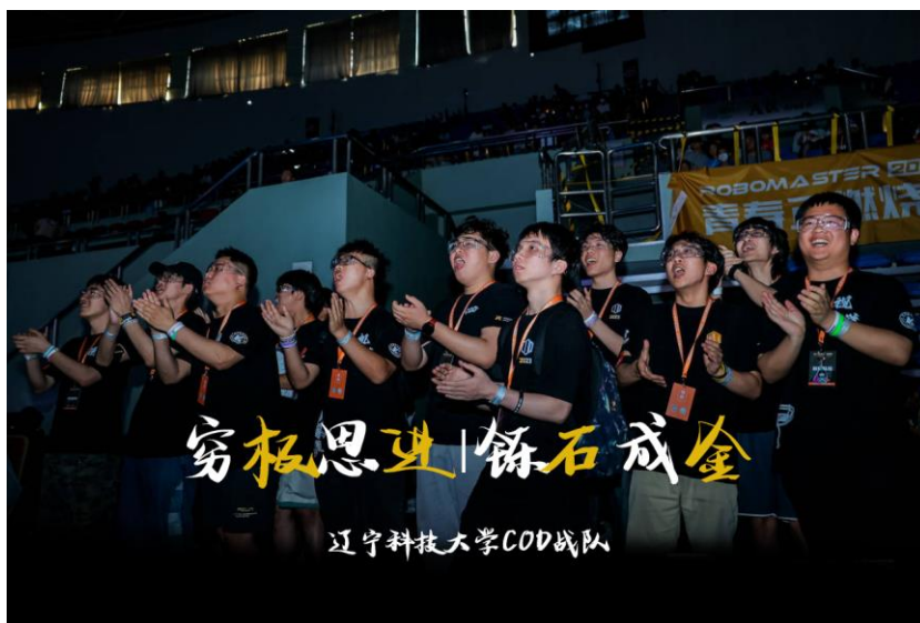
图 3-2 赛场图片