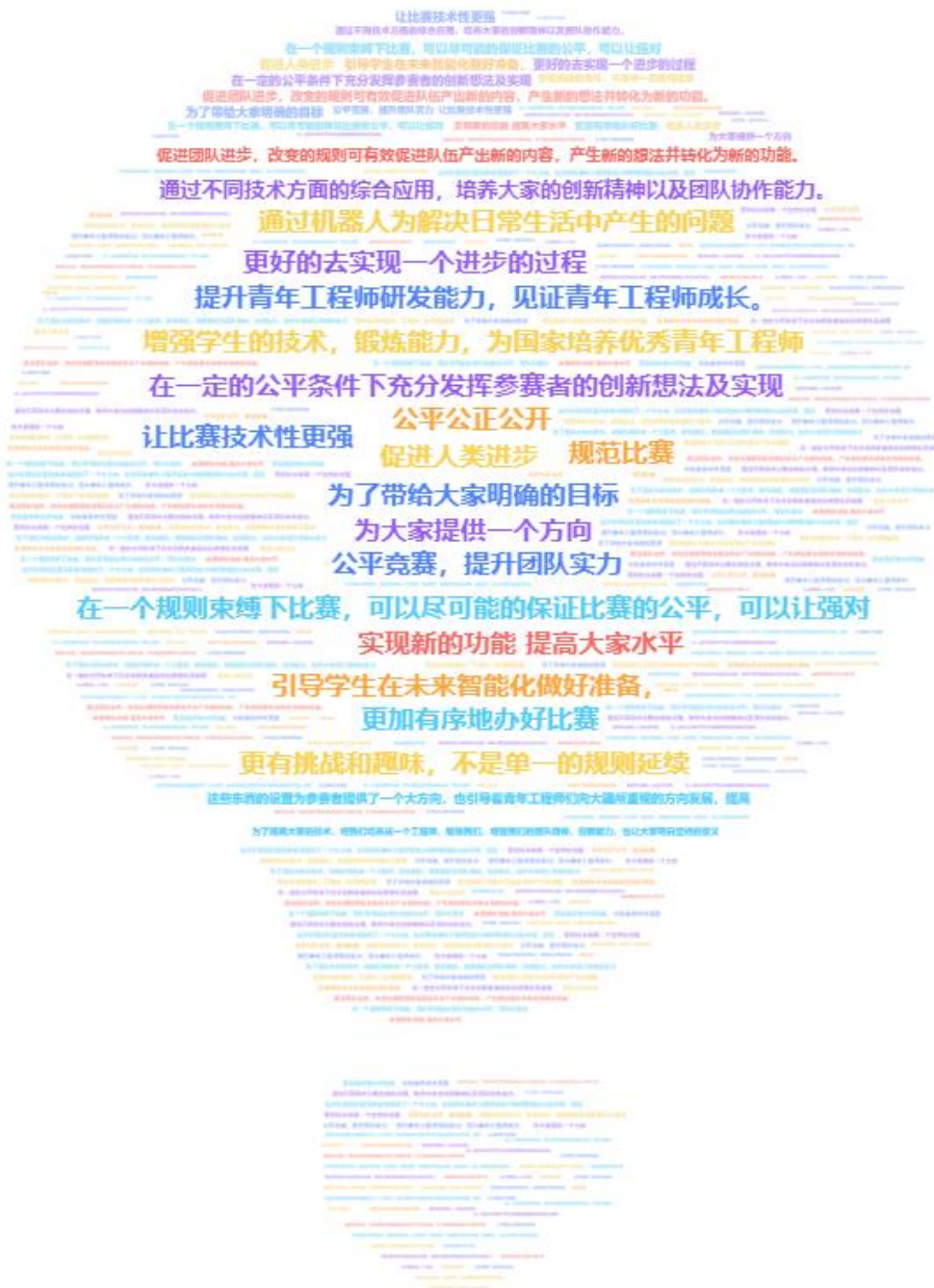
图 3 你个人理解的规则和比赛内容设置的目的是什么？

我们认为赛事规则和比赛内容设置的目的是将理论与实践结合到一起，知行合一，做一名优秀的青年工程师。对技术要求的不断提升，强调队伍输出更高水平的技术支持，逐渐偏向于人工智能，自动机器人方向；而比赛以机器人射击对抗为主要形式，采用对抗射击推塔模式进行比赛胜负判定，让队员在整个备赛期间除了追求对技术点的突破还激发了对机甲竞技的激情，让战队的每个队员整个备赛期间在这种氛围下进行相关功能的机器人制作设计，优化机器人的各项性能水平，锻炼战队的团队协作临场应变能力。比赛让工匠精神得到了内化，培养工程师去本能的思考和创作，在比赛中领会工匠精神。