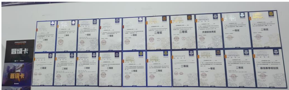
图 3-13 荣誉墙