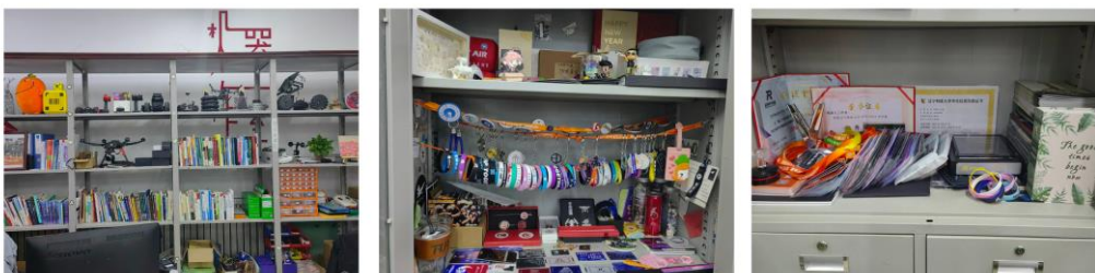
图 3-14 周边、文化角