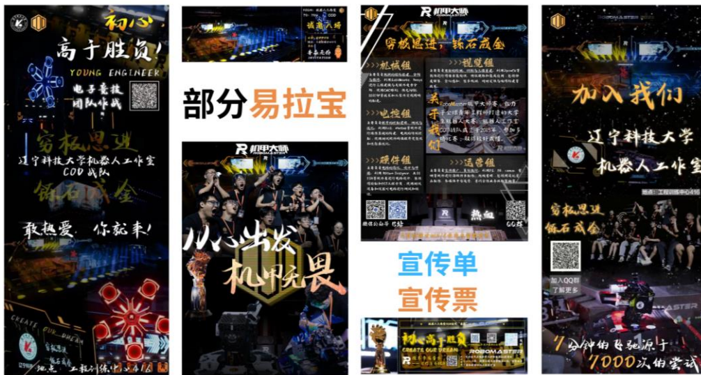
图 3-16 易拉宝、周边