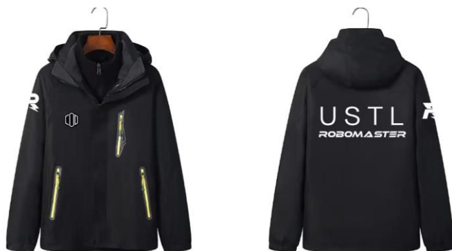
图 3-5 队服——冲锋衣