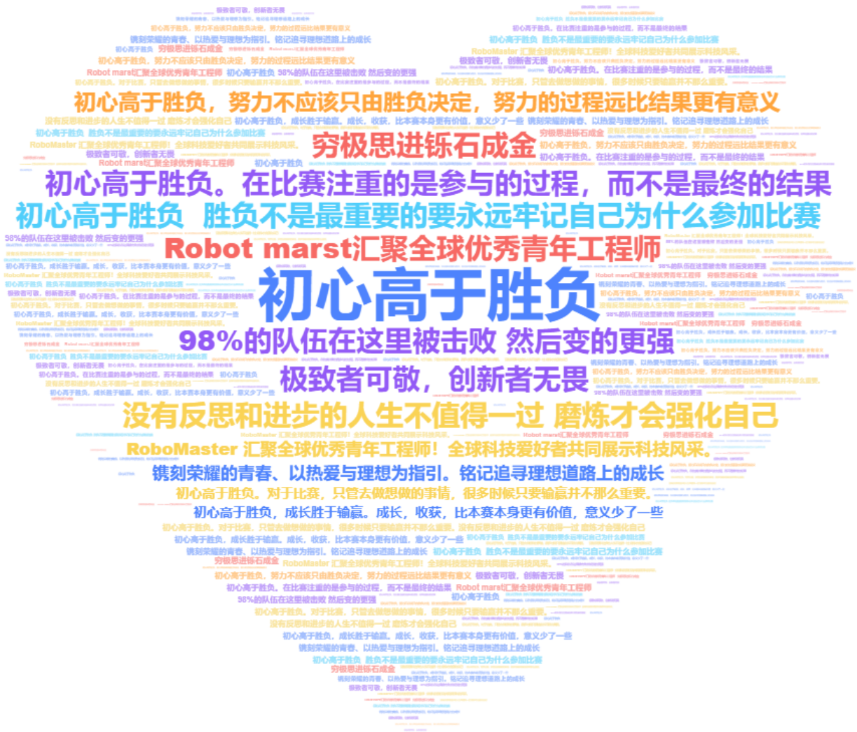
图 2 最吸引你的一句口号是什么？

战队内部，绝大部分队员都认为“初心高于胜负”是最吸引到我们的一句口号。在 RM 里不仅可以将在课内所学到的知识运用到现实中，更能让我们与其他专业的同学进行合作，增强团队意识，锻炼团队协作能力。每一位 RMer 为了能让自己的机器人在赛场上有更出色地表现，会经过长达约一年多时间的通力合作。每个技术节点的钻研探讨、每次迭代后的优化升级，这其中就蕴含着“初心高于胜负”的本质：热血青春中义无反顾的拼尽全力、追寻机甲梦的不懈坚持、直面输赢的勇气、夜以继日不变的初心、追求极致的热爱、突破极限的创新、分享交流的纯粹、向着一个目标拼搏的团结。RoboMaster 对每个队员而言不仅仅是一场比赛，更是一场充满青春活力的盛宴！