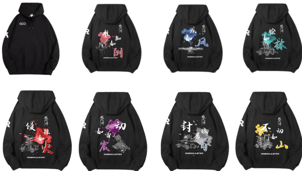
图 3-4 队服——卫衣