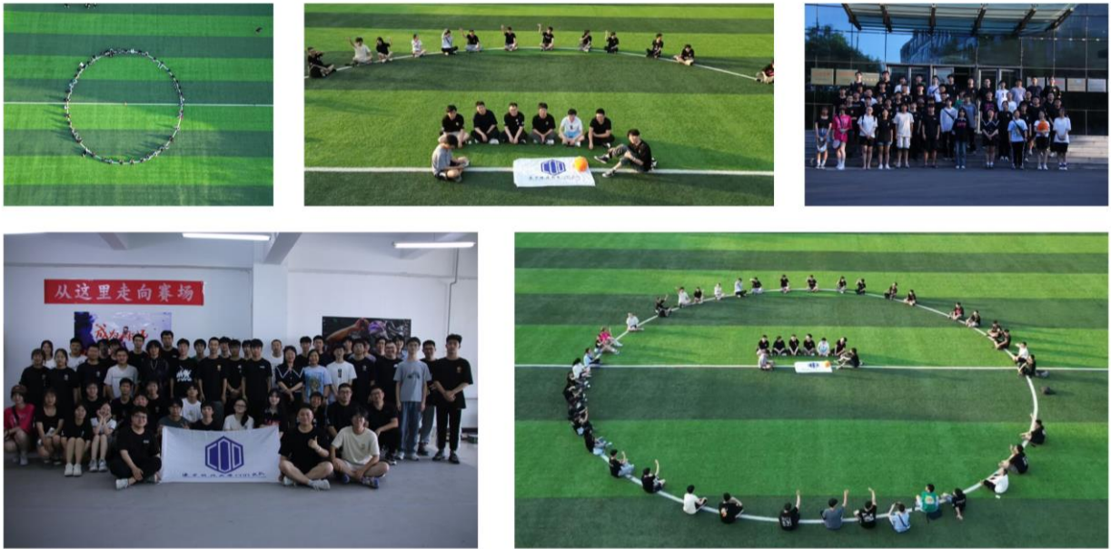
图 3-12 队员合照