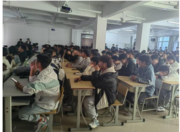
图 3-8、图 3-9 宣讲会