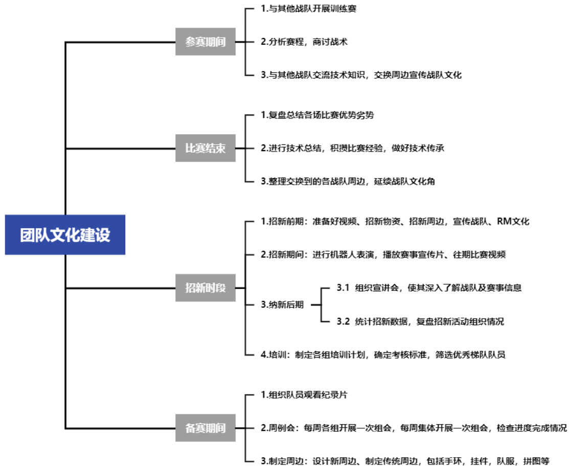
图 3-6 团队文化建设

① 每赛季初期组织一次较为大型的团队建设活动，邀请新老队员和指导老师一起参与。在团队建设中进行新老队员的自我介绍以及对 RoboMaster 系列比赛的认识与展望，以加深新队员们对战队的集体感和归属感；